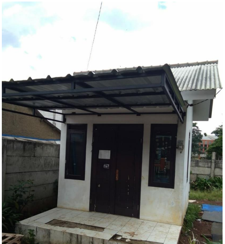
Foto kanopi setelah direnovasi