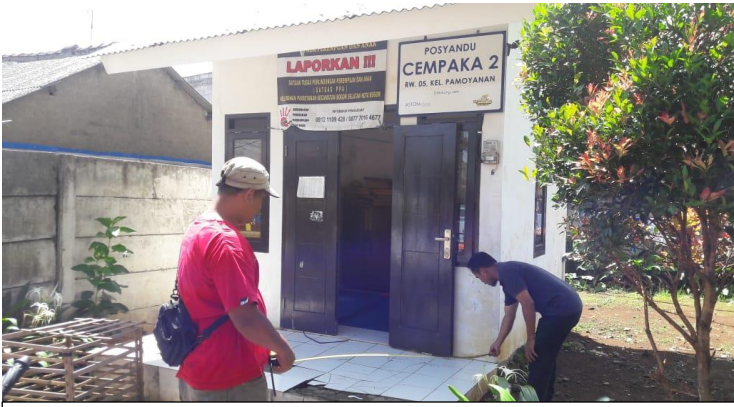
Foto lantai sebelum direnovasi