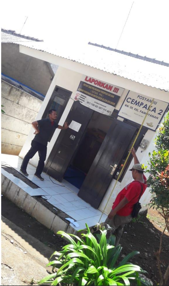
Foto sebelum direnovasi